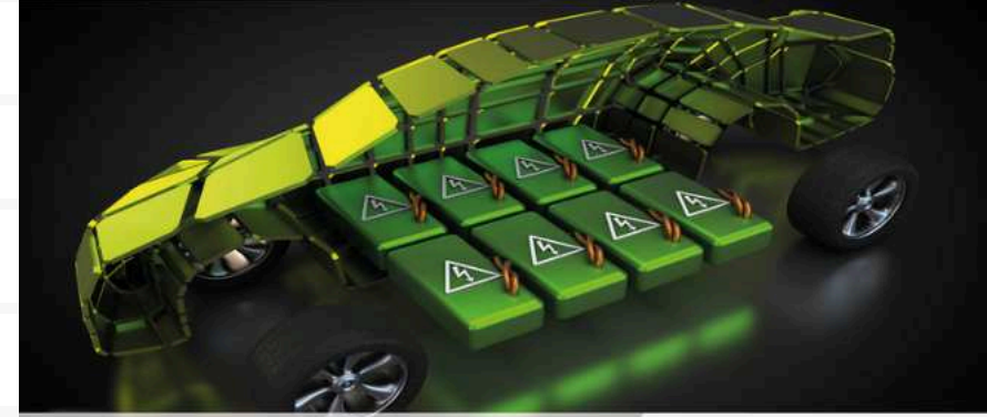
BATTERY SAFETY TALK